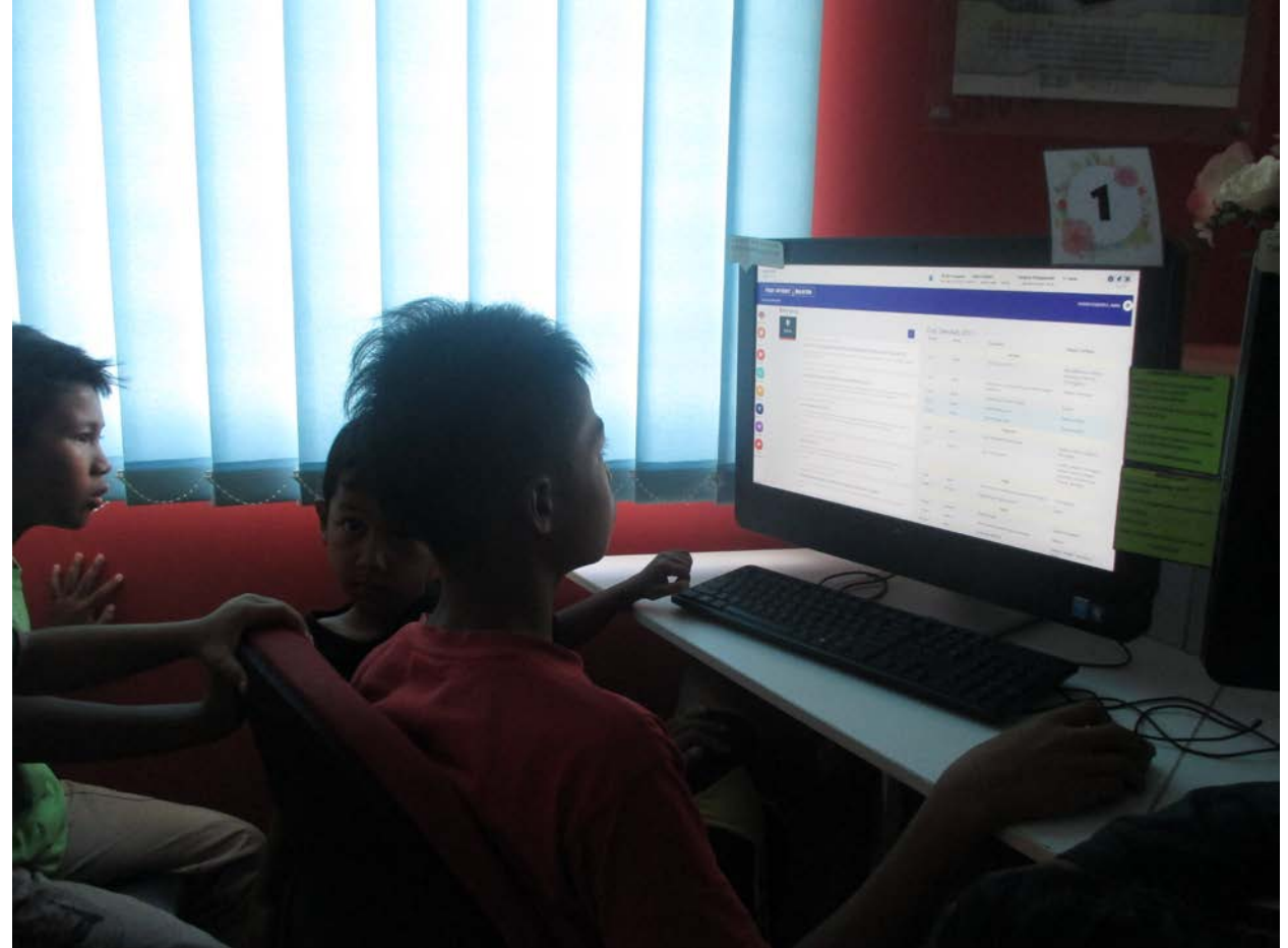
Salah seorang pelajar melihat pengumuman di MySkool