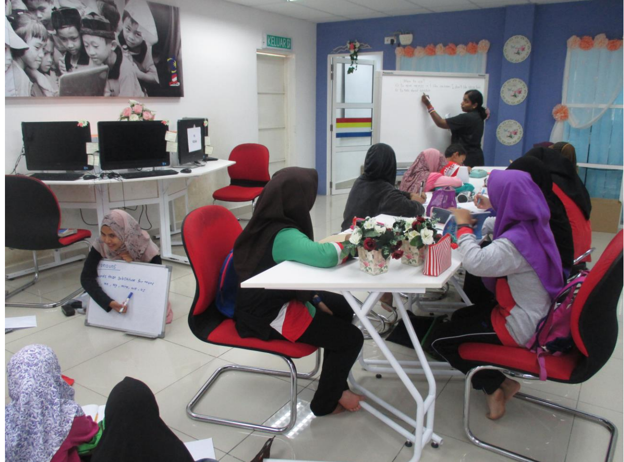
Kelas di bahagi kepada pelajar menengah dan rendah

Photo caption names Keterangan gambar berserta nama